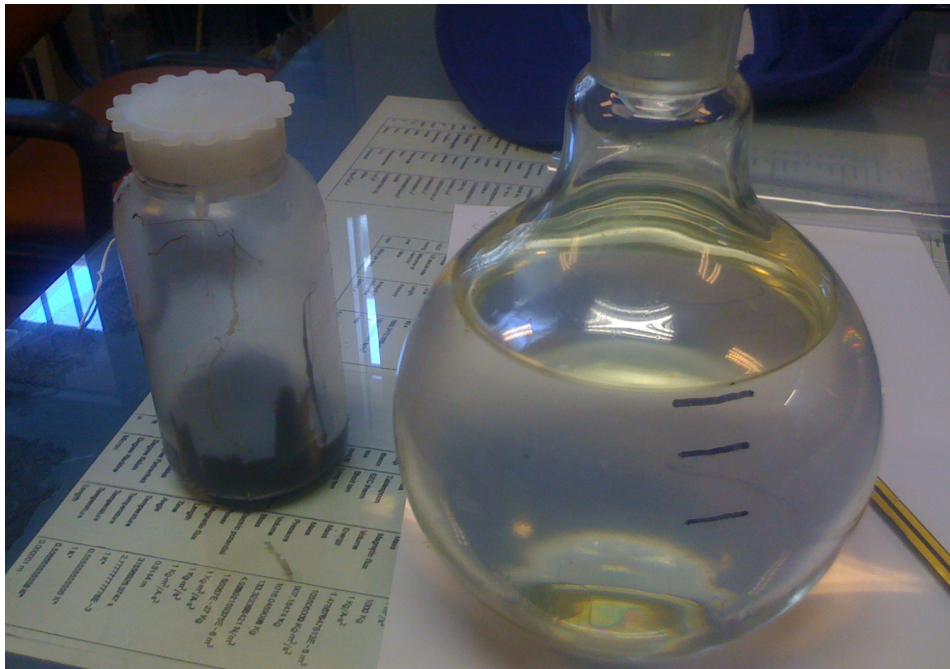
Restprodukt samt renat lösningsmedel för återanvändning.